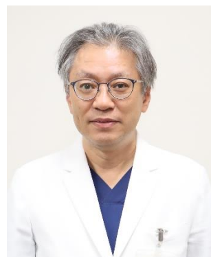
津山中央病院 内科 地域連携担当