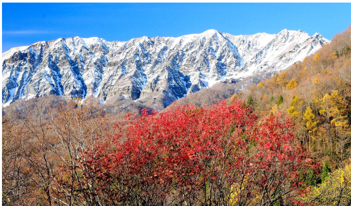
鍵掛峠からの冠雪大山（鳥取県日野郡）