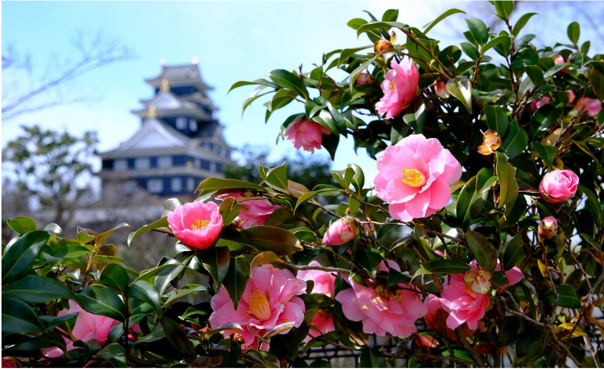
岡山後楽園（岡山市）