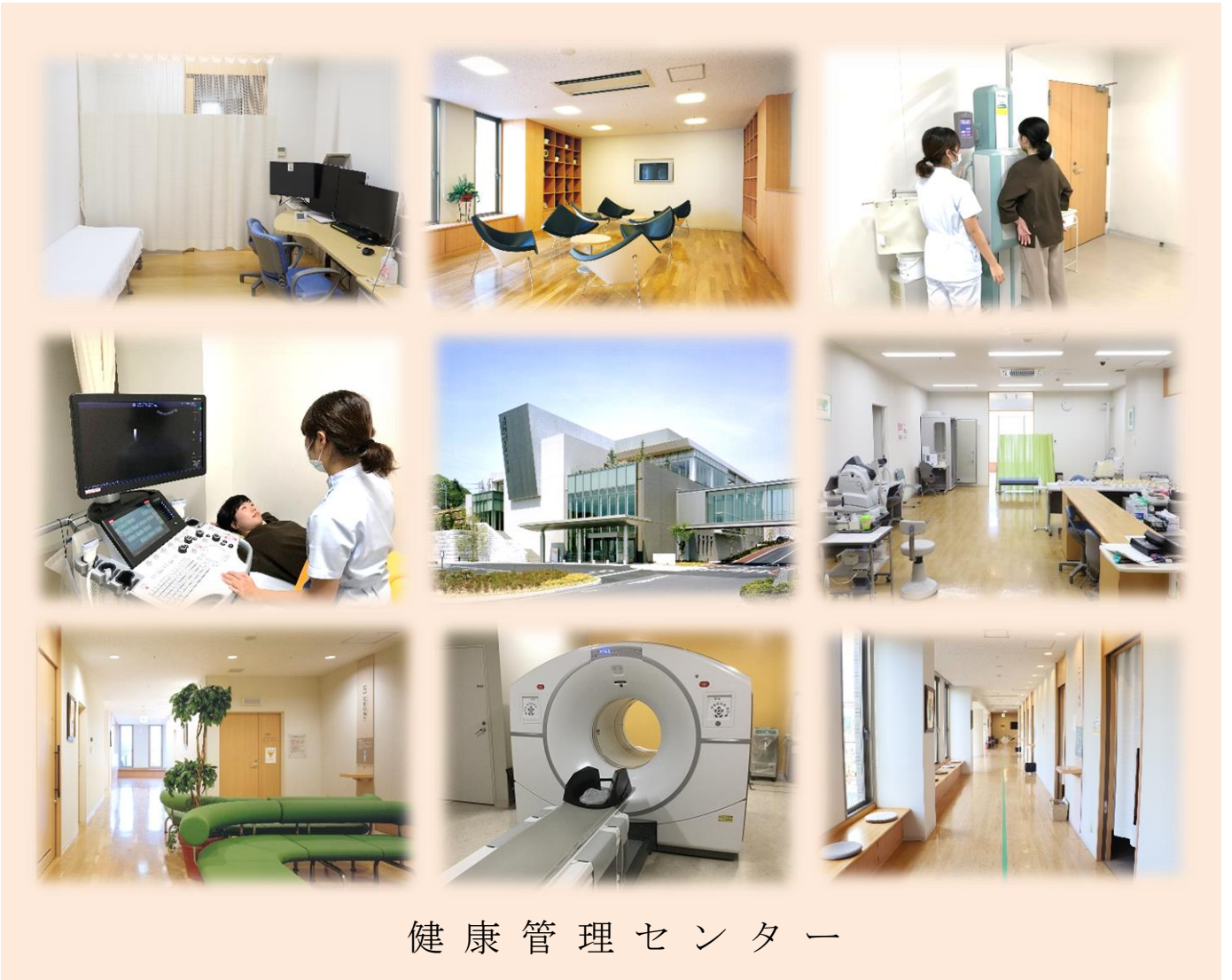
健康管理センター