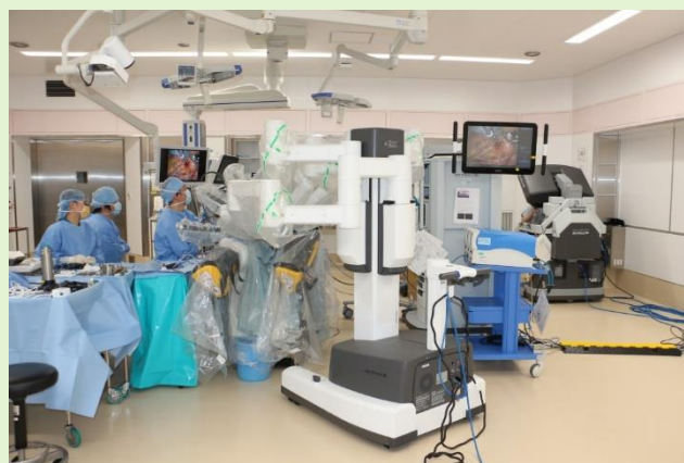
結腸ダヴィンチ手術術中写真