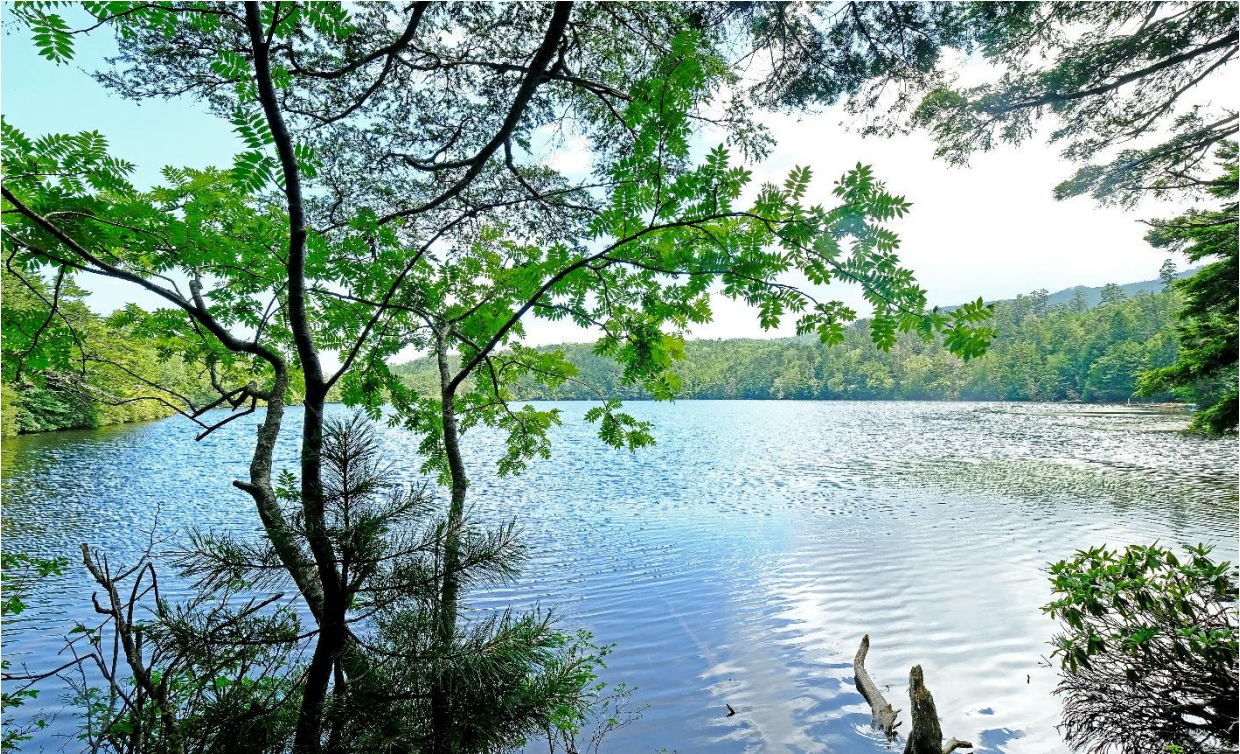
白駒の池（長野県南佐久郡）