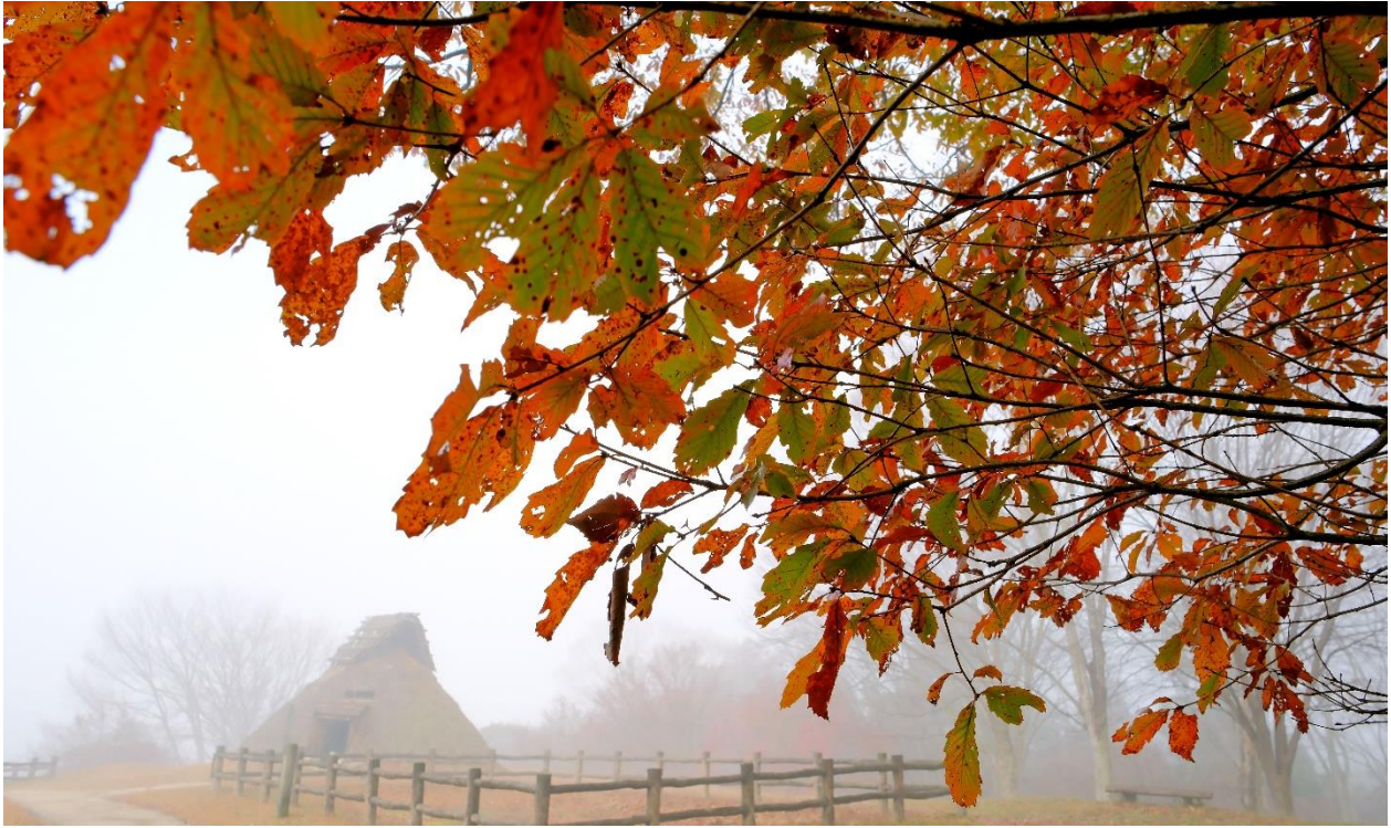
霧の住居址（津山市）