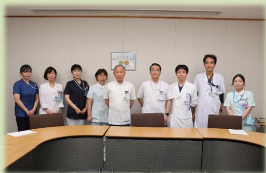
緩和ケアスタッフ

当院の緩和ケア外来、病棟はやや特殊な運用で開始する形となります。県北のがん患者さんが安心して緩和治療・終末期医療を受けてもらえるように徐々に育てていくものと考えております。