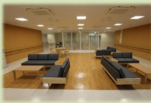
緩和ケア病棟 談話室