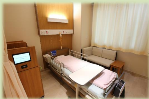
緩和ケア病棟 病室