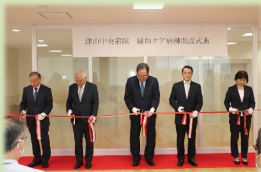
緩和ケア病棟開設式典