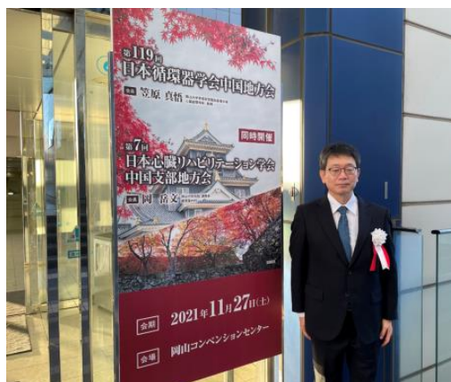
第7回日本心臓リハビリテーション学会中国支部地方会

これからも自らが制限をかけることなく、いろいろなことに挑戦できればと思いますが、増え続ける心不全患者さんの対応は急務です。インペラという新しい補助循環も導入間際です。また、コロナ禍で休止している北部循環器カンファレンスを再開し、以前のような病診連携ができれば思っております。今後ともご指導宜しくお願い申し上げます。