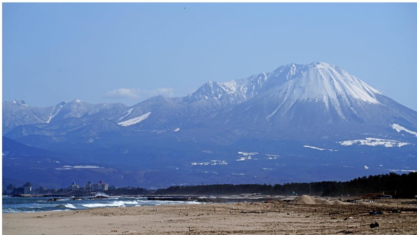
大山北壁（鳥取県米子市）