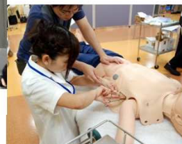
医師研修セミナー