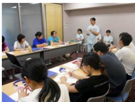
新人看護職員研修